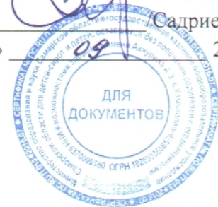
График работы учителя – дефектолога